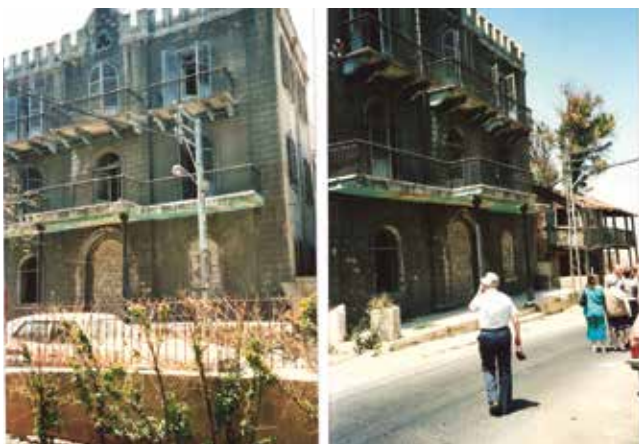
איור 4. חזית מלון ירושלים. מבנה מסוכן, נטוש וסגור, 1978.