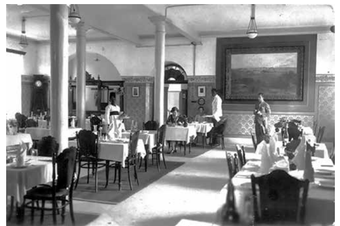
איור 3. חדר האוכל של המלון בשנת 1925 לערך.

שימור המבנה בתכנונו ופיקוחו של מהנדס השימור יעקב שפר היה אבן דרך בתולדות השימור בתל-אביב. הנופך המיוחד של בית העץ הרומנטי שבו שכנה המסעדה (עד שנסגרה בשנת 2002) ומיקומה בלב המושבה הוותיקה תרמו לייחודו של המקום והבטיחו את המשך פיתוחה ומיצובה של המושבה כשכונת מגורים אקסקלוסיבית.