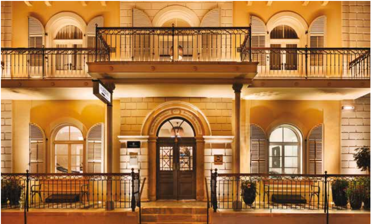
איור 7. מלון דריסקו לאחר השימור.