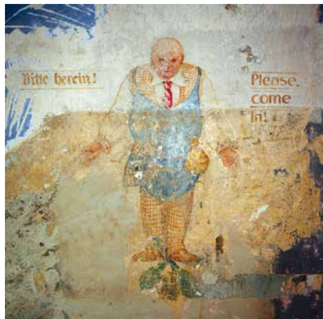
איור 5. בעל מרתף הבירה בציור קיר במלון ירושלים, לפני השימור ולאחריו.

כתחליף למדרגות העץ פשוטות, תשתיות אינסטלציה משוכללות הקשורות במערכת שאיבה בוואקום ללא שימוש בגרביטציה, מערכת תנועה פנימית נגישה ומלאה. כל אלה אינם נראים לעינו של האורח, והחוויה המרכזית היא של בית מלון היסטורי אותנטי מהמאה ה-19. ביצוע העבודות הסתיים במהלך שנת 2018, ולאחר כ-18 חודשים של עבודות אינטנסיביות נפתח המלון. לטקס הפתיחה הוזמנו שר התיירות, ראש עיריית יפו-תל-אביב ואורחים רבים מכל רחבי העולם (איורים 6, 7).