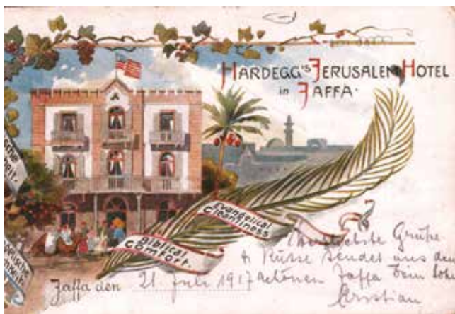
איור 2. מלון ירושלים בגלוייה שצייר ארנסט הרדג, בעל המלון, 1895.