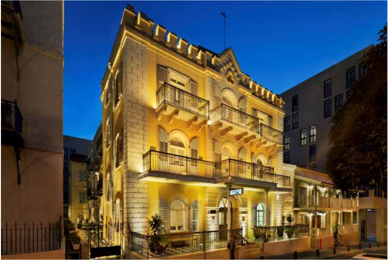
איור 6. תצלום חזיתי של מלון ירושלים ובית נורטון לאחר השימור, 2018.